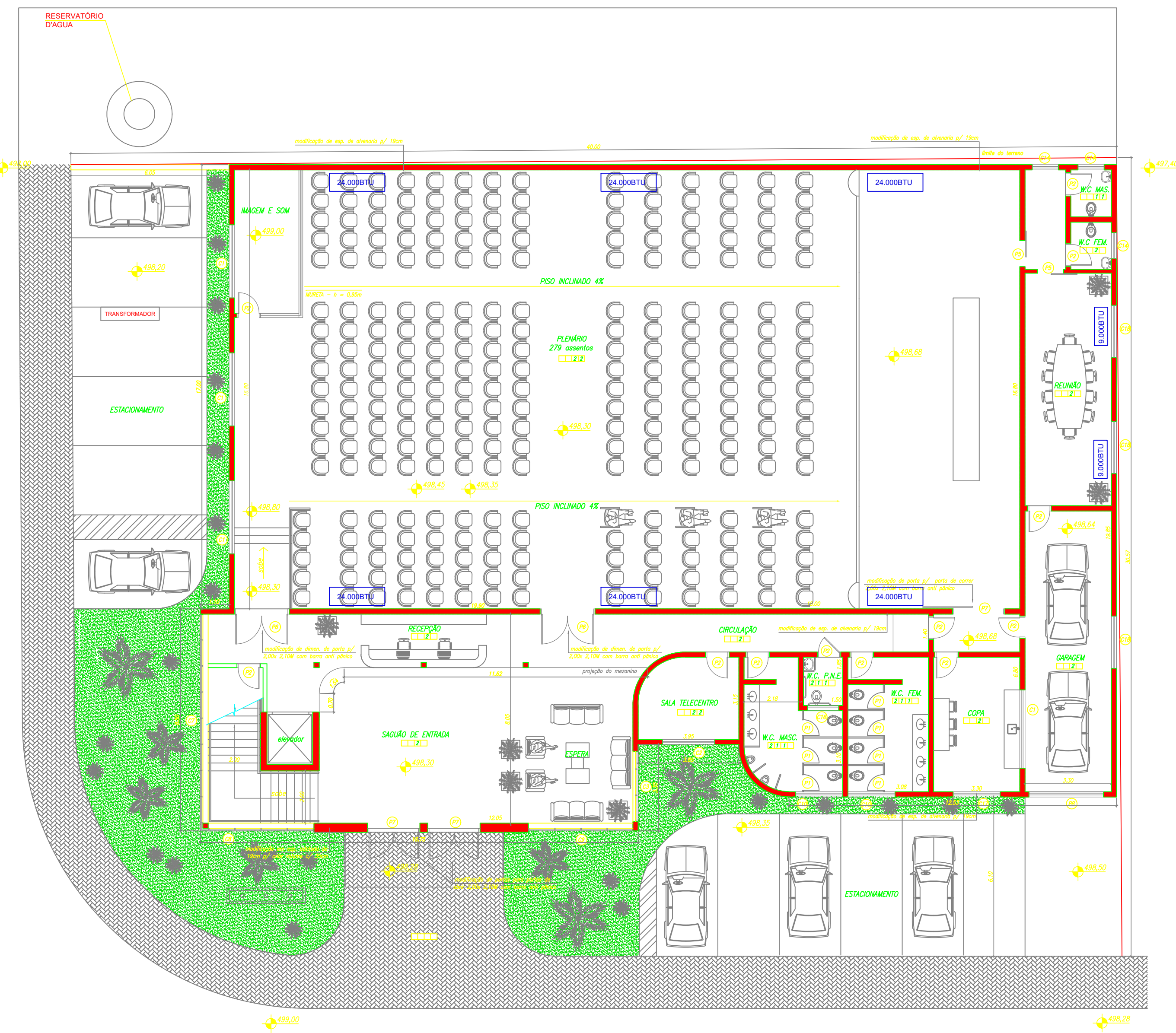
PLANTA PAV. TÉRREO ESC 1 : 125